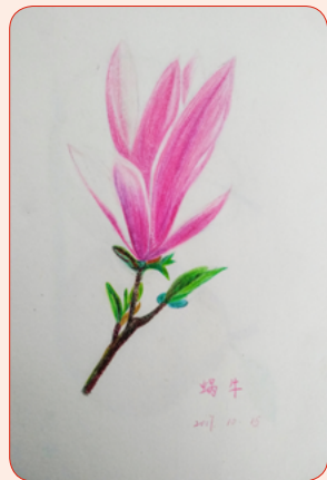
◆ 安泰南瑞 景艳