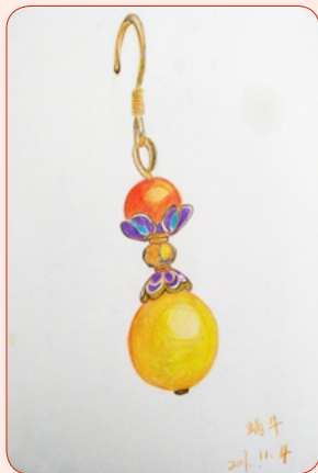
◆ 安泰南瑞 景艳

三毛老师曾在给读者的一封信中写到“人在外邦走路，胆大心细是必备的条件。将那逆旅当做顺境，将那五分苦比做七分乐，将那七分苦比做十分苦的减法，还赚了三分不苦。生命的乐趣是靠自己去创造的，小小的挫折正是柳暗花明的最好解释，实在不必担心自己承受不了。”这样想一想，生活反而过得也不亦乐乎，不是吗！喜，油然而生！